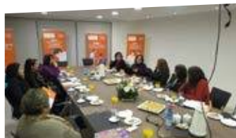
Consejo Asesor del Área Salud

Los consejos establecidos durante 2017 han continuado con sus funciones en el presente año. Lo que ha permitido trabajar en temáticas referidas al desarrollo estratégico de las distintas áreas.