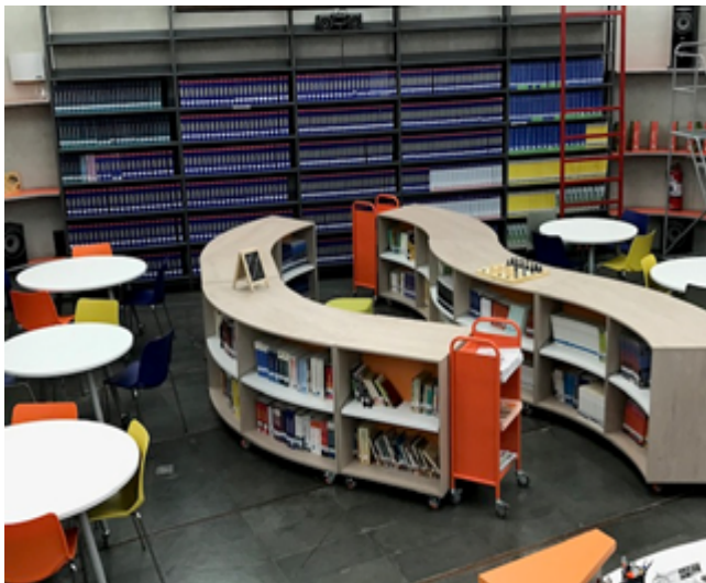
Parte de la modernización

Todo esto ha permitido desarrollar el trabajo de modernización de la unidad, pudiendo migrar desde Sistema de gestión de bibliotecas VEL2000, al Sistema de Gestión Integrado de bibliotecas KOHA, lo cual permite contar con un moderno sistema de gestión que cumple con todos los estándares necesarios para gestionar la unidad. Entre sus características destaca: los módulos de gestión de usuarios, circulación, reportes, administración entre otros. Por medio de este sistema, actualmente, se cuenta con un portal de biblioteca (responsivo: puede ser visualizado desde cualquier dispositivo móvil), donde se aúnan los servicios ofrecidos por la unidad a la comunidad CFT ENAC, accediendo desde: http://biblioteca.enac.cl/