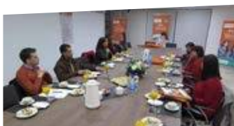
Consejo Asesor del Área Educación