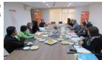
Consejo Asesor del Área Social

Los consejos establecidos durante 2017 han continuado con sus funciones en el presente año. Lo que ha permitido trabajar en temáticas referidas al desarrollo estratégico de las distintas áreas.