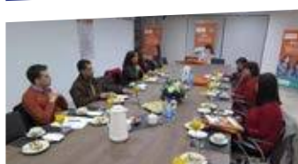
Consejo Asesor del Área Educación