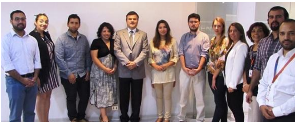
Conversatorio en torno a la apropiación e implementación del Marco de Cualificaciones.