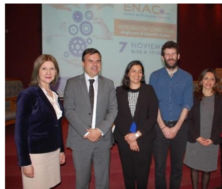
Seminario "Integración Curricular"